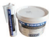
EOCRYL M1 Mastic acrylique