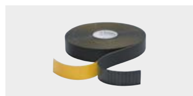
TAPE Tape auto-adhésif