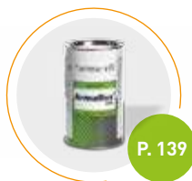
Colle Armaflex HT625