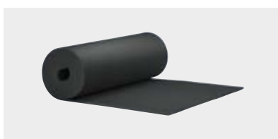
ROULEAUX Plaques en rouleau