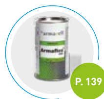
Colle Armaflex 520