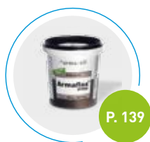
Colle Armaflex SF990