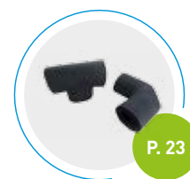
Coudes et pièces en T préfabriqués