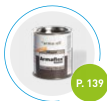
Colle Armaflex RS850