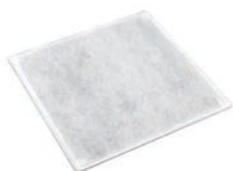
FLK-BSP Filtre de rechange