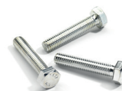
Vis tête hexagonale