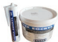
EOCRYL M1 Mastic acrylique