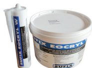
EOCRYL M1 Mastic acrylique