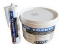
EOCRYL M1 Mastic acrylique 1 / 1 FR-FR TO / TRO - 2020/01/08 O