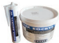
EOCRYL M1 Mastic acrylique 1 / 1 FR-FR TE / TRE - 2020/01/08 O