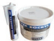
EOCRYL M1 Mastic acrylique