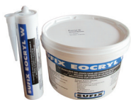
EOCRYL M1 Mastic acrylique