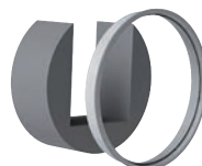
ACOUS Mousse acoustique