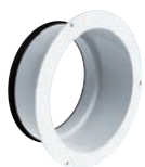
MP-J Manchette à joint