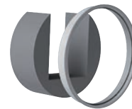
ACOUS Mousse acoustique